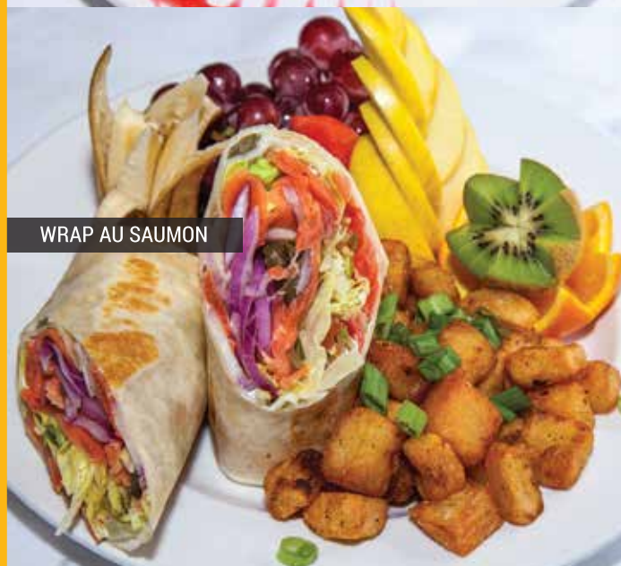
WRAP AU SAUMON