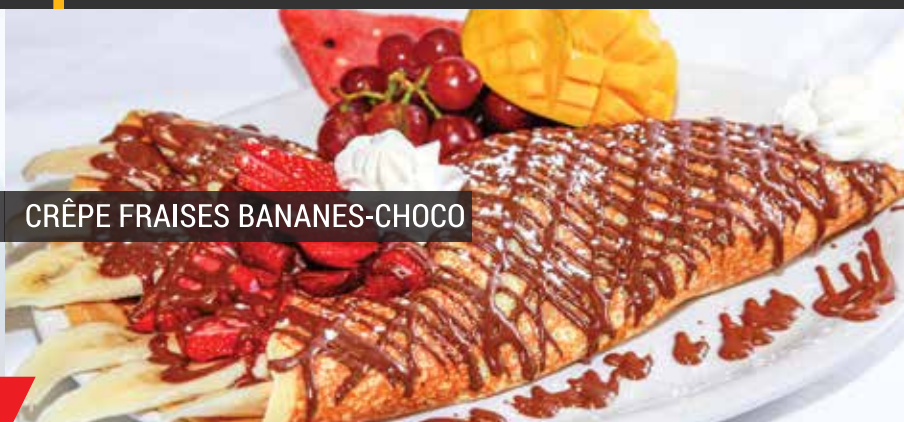
CRÊPE FRAISES BANANES-CHOCO