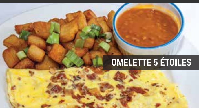
OMELETTE 5 ÉTOILES

3 crêpes pâte au chocolat servies avec une avalanche de fruits, le tout recouvert de crème anglaise et d'un coulis de fraises 3 hazelnut chocolate pancakes with loads of fresh fruits covered with custard and strawberry coulis